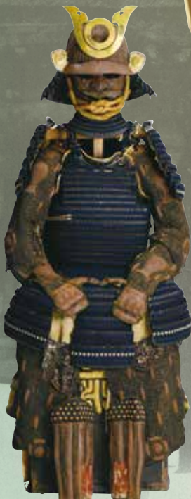
伝 近藤勇所用 紺糸威二枚胴具足(伝 山岡鉄舟寄進)