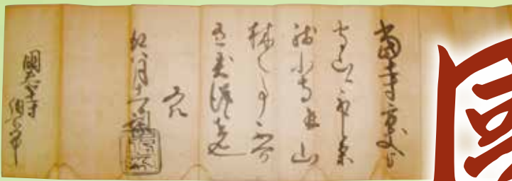
[天文13年(1585)]開8月11日付 前田利家安堵状(國泰寺納所宛) [高岡市指定文化財]

入館無料 ◎開館時間:午前9時~午後5時(入館は午後4時30分まで) ◎休館日:月曜日(ただし祝休日の場合は開館し、翌平日休館)