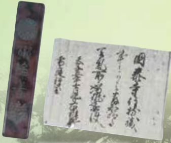
天文15年(1546)10月9日付 雪庭祝陽住持職補任口宣案