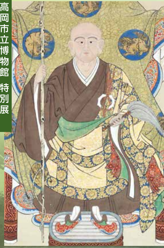
絹本着色 開山国師 頂相(部分) 法橋栄賢筆 独園承珠賛 明治6年(1873)

高岡市太田にある古刹・國泰寺(臨濟宗國泰寺派大本山)の開山国師・慈雲妙意(清泉禪師)生誕750年の節目にあわせて、同寺に伝わる古文書等の資料を展示・紹介。